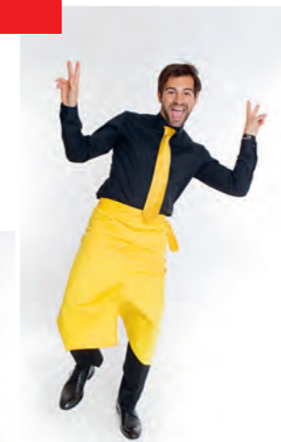
Outfits, die garantiert ein Hingucker sind. Die Kombinationsmöglichkeiten sind nahezu endlos.