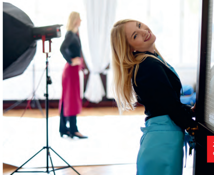
Zu einem schönen Look gehört das perfekte Make-up.