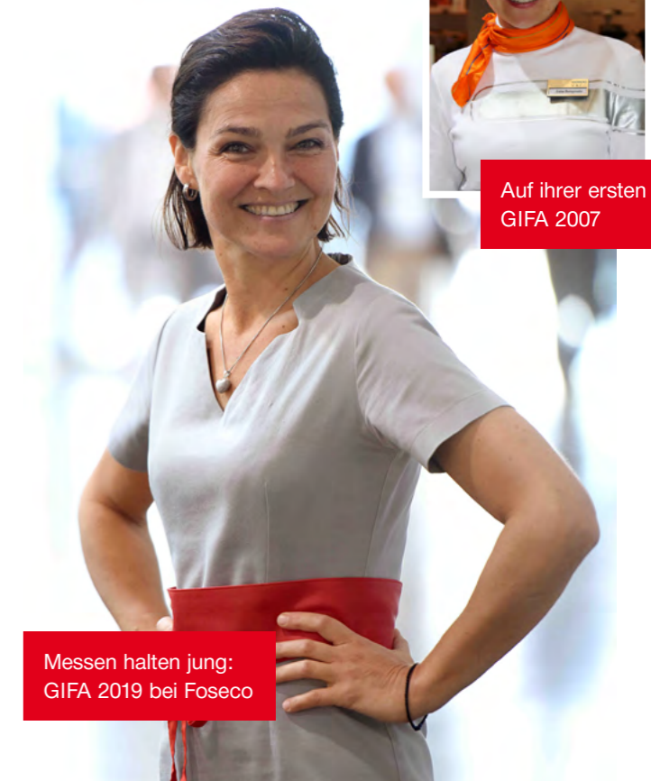
Messen halten jung: GIFA 2019 bei Foseco