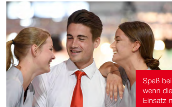
Spaß bei der Arbeit – auch wenn die Füße beim ersten Einsatz noch weh tun