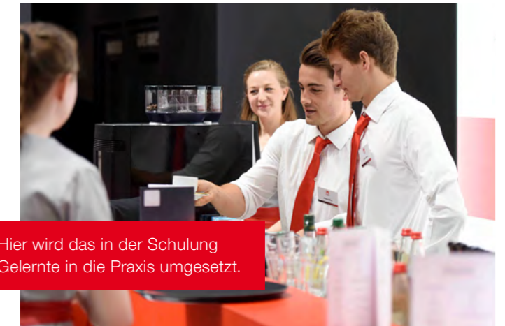
Hier wird das in der Schulung Gelernte in die Praxis umgesetzt.

Ein bisschen erschrocken haben wir uns ja schon, als da die ersten Bewerber mit Jahrgang 2000 in unserer Hostessen-Kartei auftauchten. (Wann genau waren wir so alt geworden?) Was hatte man nicht alles gehört und gelesen über die Generation Z, digital Natives, die ohne ihr Handy nicht mehr lebensfähig sind. Aber von wegen – unsere Rookies bei Foseco haben uns mit ihrem Elan im Service und an der Bar begeistert.